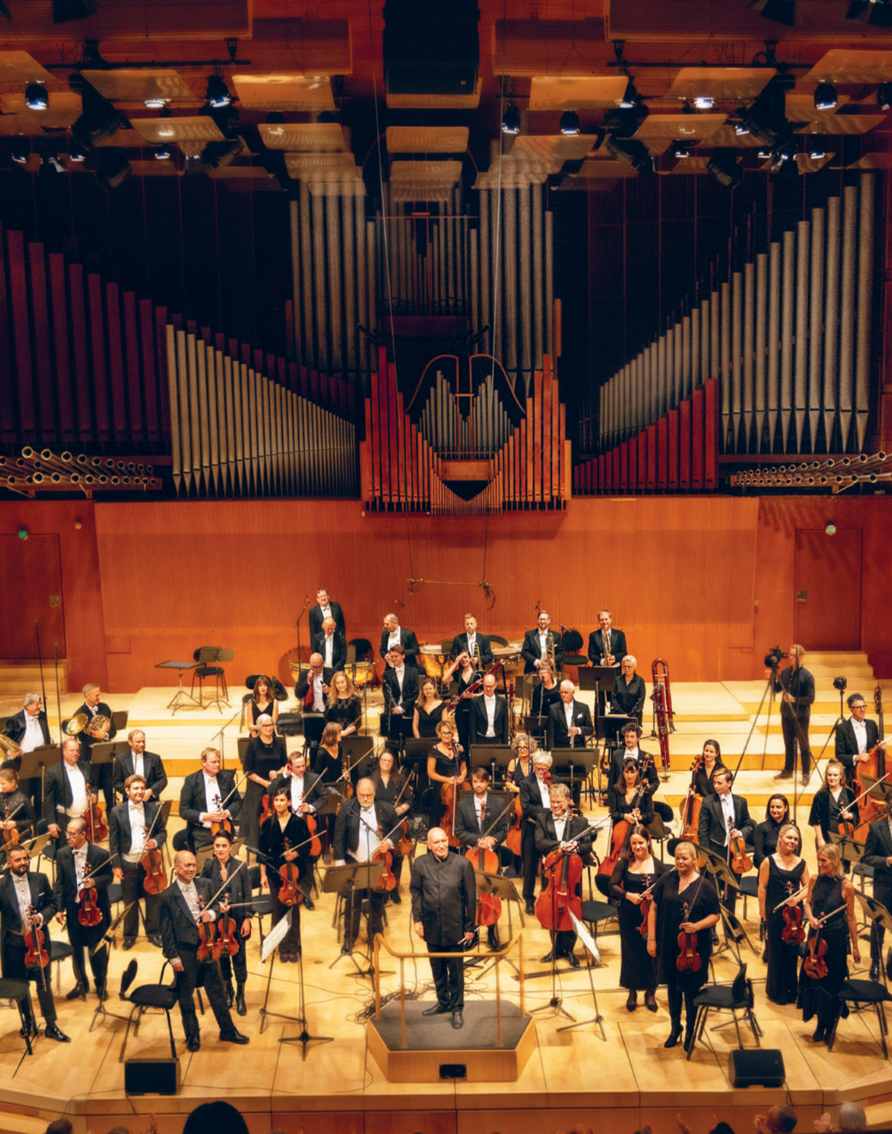
Maestro Eschenbach & Copenhagen Phil / Foto: Per Morten Abrahamsen