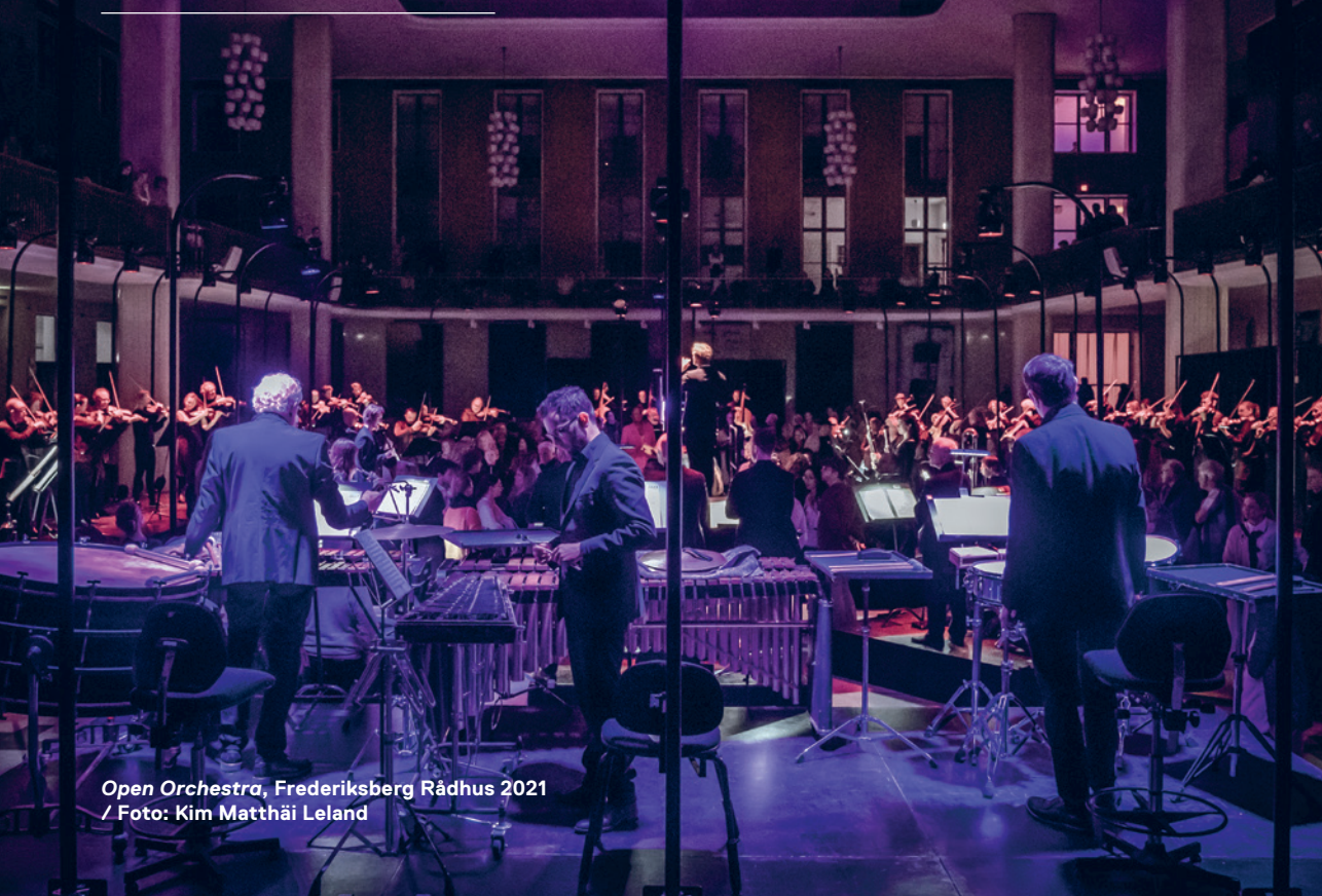
Open Orchestra, Frederiksberg Rådhus 2021 / Foto: Kim Matthäi Leland

Turné på Sjælland og Lolland/Falster Oktober-november 2022